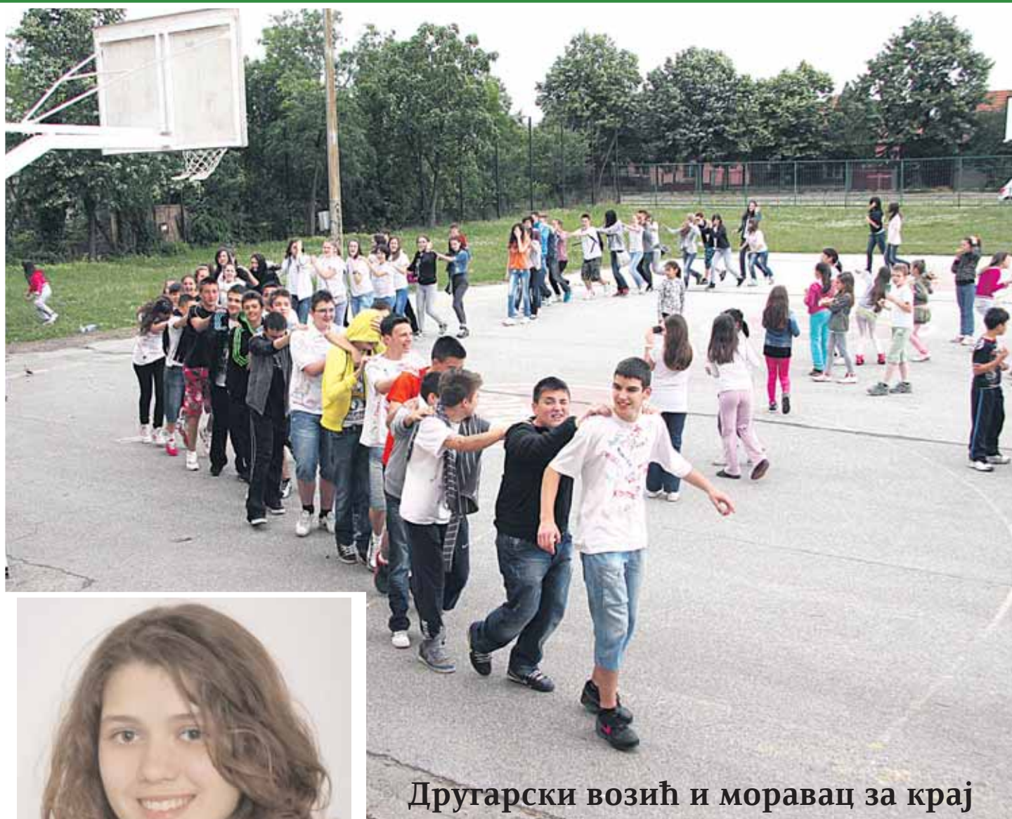
Другарски возић и моравац за крај

ЛИСТ ОСНОВНЕ ШКОЛЕ „ИСИДОРА СЕКУЛИЋ“ • ЈУН 2013 • БРОЈ 4